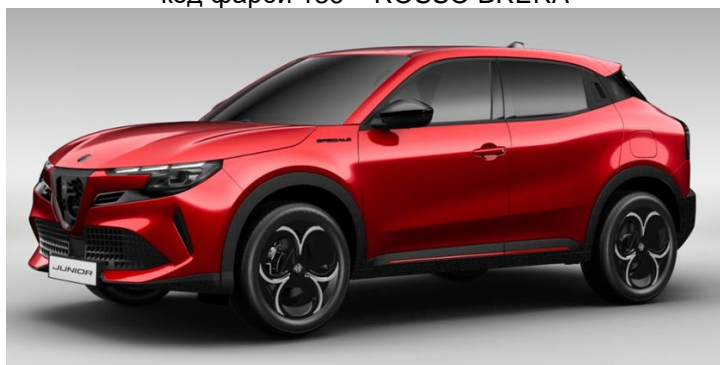
Забарвлення кузова фарбою металік, червоного кольору, код фарби 136 – ROSSO BRERA